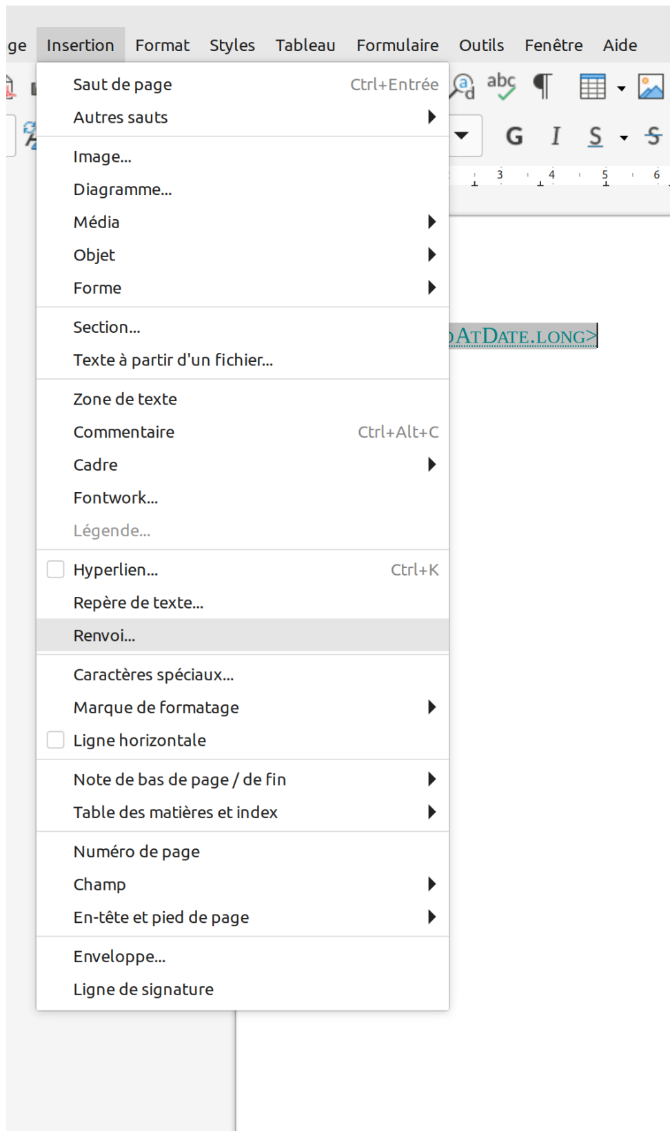
FIGURE 1 – Menu Insertion > Renvoi dans LibreOffice